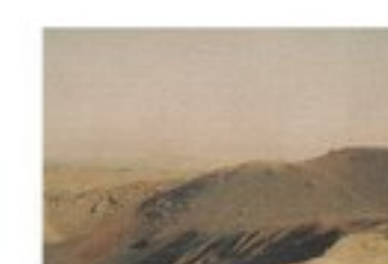
イラナ・ハルペリン