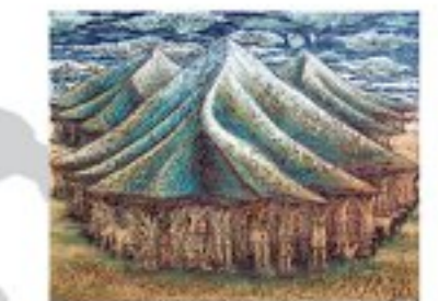
ヌグロホ・ヘリ・カヒョノ