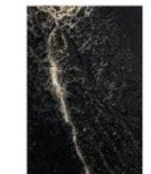
ステフ・フェルトハイス