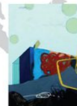
ヴィシュヌアジ・プトゥ