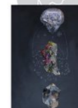
ゲオルグ・ヤグノヴ