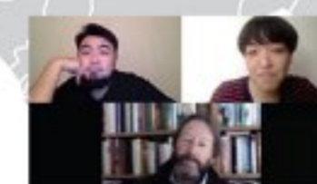
名もなき日々の試み... X ワゴン