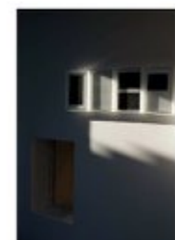
アラン・ジョンストン