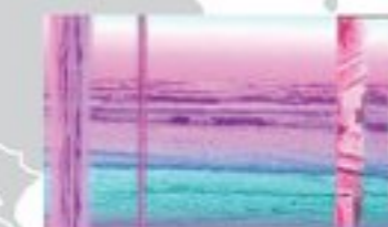
ドモコス / フューチャー・ブロンズ