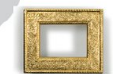
ヒュック・ジュン・イ